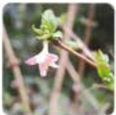
ウグイスカグラ (2月)