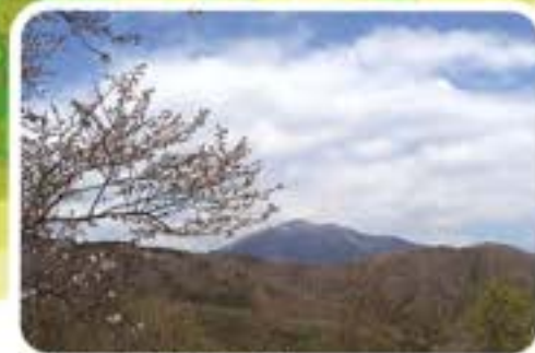
塔の山 山頂から見た大山