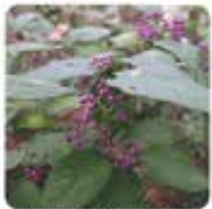
ムラサキシキブ (11月)